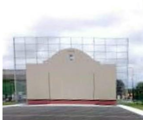
Saint Julien en Born

Rénovation également des canchas de Mées et Vielle Saint Girons